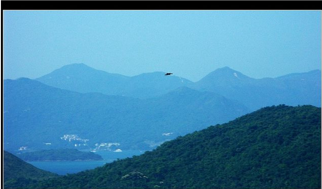
清水灣白水碗午間閒遊

由起點往下慢走，約二~三十分鐘路程，便到達白水碗沙灘，跟科技大學的碼頭祇是數箭之遙。在這裡，岩石，樹木，海浪，昆蟲．．．互相傾談，互相慰問，充滿寧靜與諧和。靜下來，收斂心神，看看海，望望天，眺眺山，一大樂事。如有興趣；可往岩石上倚卧，感受一下『行到水窮處，坐看雲起時』。